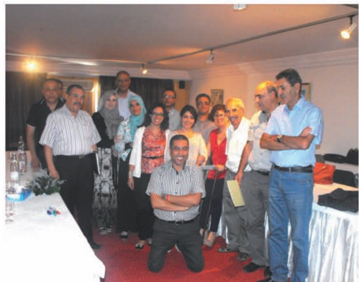
Groupe de travail de l'atelier Stratégie de l'AMSSA 2015-2020

L'atelier a regroupé les membres du BE de l'AMSSA, des représentants des institutions publiques et privées, des associations amies et des membres de l'AMSSA dont le GIPAC fait partie.