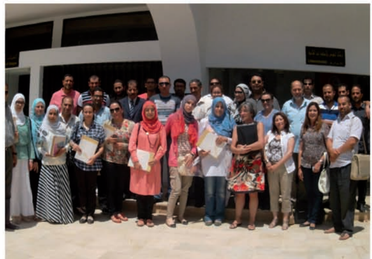
Groupe de formation en Insémination Artificielle des Lapins à l'INAT 2014