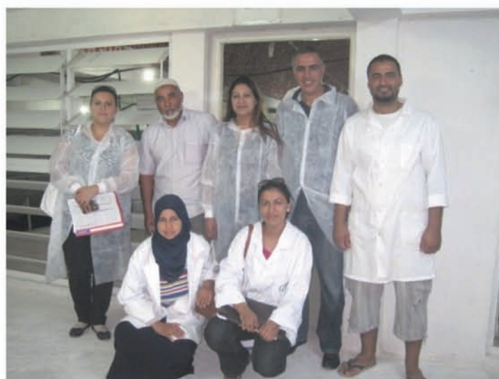
Commission de suivi des centres de reproducteurs de lapins au sein d'une visite sur terrain

Un rapport d'audit va être rédigé et distribué lors d'une prochaine réunion.