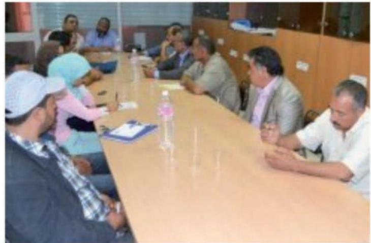
Réunion de la Fédération Nationale des Cuniculteurs

Lors de cette réunion, les membres de la fédération se sont mis d'accord sur l'importance de la création d'une société mutuelle centrale et le rôle qu'elle va jouer dans l'encadrement technique des éleveurs, l'encadrement sanitaire à travers une convention avec des vétérinaires officiels chargés de contrôle et de suivi des élevages de lapins. Cette structure permet d'assurer des achats regroupés (les intrants : les animaux, les aliments et le matériel d'élevage) .