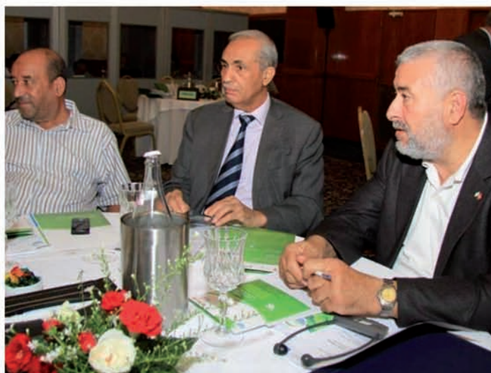
Le président de l'UTAP en compagnie du président de l'UMNAGRI lors du séminaire de clôture du Projet Agro Med Quality