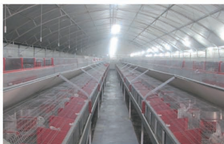
Bâtiment de 1000 unités femelles de lapin de chair Chaouat 2014