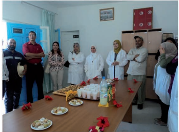
Nouveaux promoteurs lors d'une formation en élevage de lapins