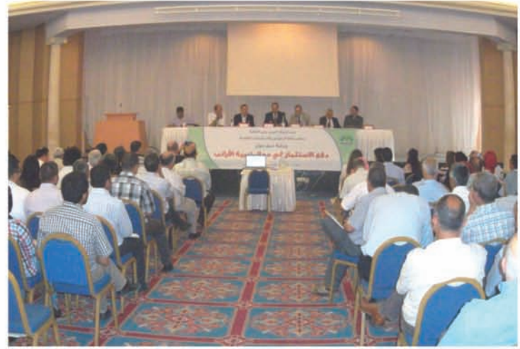
Journée Nationale sur La Promotion de l'investissement dans le secteur cunicole

Le GIPAC a édité son nouveau numéro 53 spécial « Lapins », ce numéro se caractérise par sa richesse en plusieurs thèmes importants à savoir; la génétique, l'alimentation, les pathologies et la biosécurité dans le secteur cunicole.