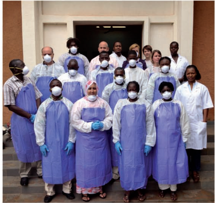
Photo de groupe des participants à l'atelier de formation

Cette page est principalement dédiée aux professionnels et à tous les intervenants du secteur. Soyez y abonnés en cliquant sur « j'aime » puis « je partage » sur notre page !